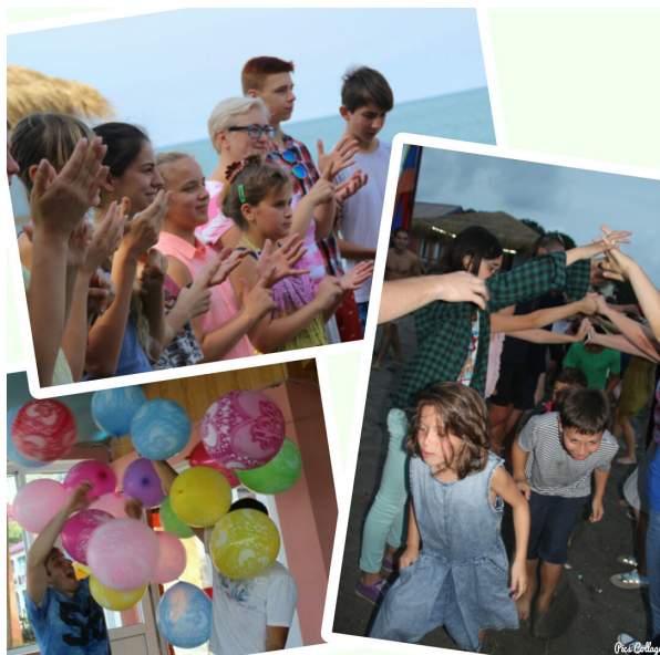
AVP-Summer-Peace Camp am Schwarzen Meer: