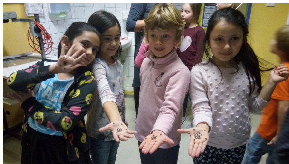
Kinder in der Eine-Welt AG Braunenberg Schule

act for transformation gemeinnützige eG Gmünder Straße 9 73430 Aalen Germany/ Deutschland