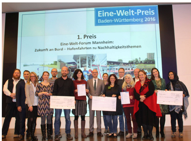
Verleihung des Eine-Welt Preis