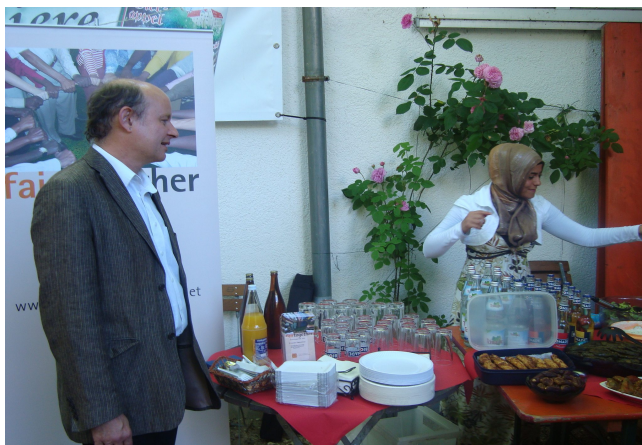
Eröffnungsfeier Projekt „Einander Fairstehen “

An einer Förderschule in Aalen wurde 2008 ein Langzeitprojekt für die SchülerInnen der 8. Jahrgangsstufe zum Training in sozialer und interkultureller Kompetenz und gewaltfreier Konfliktlösung durchgeführt. Der Grundkurs begann mit beiden Klassen und ein Aufbaukurs zum Thema „Sinnvolle Freizeitgestaltung“ wurde mit Interessierten fortgesetzt. Der Grundkurs wurde auch mit der 5./6. Klasse an einer Hauptschule durchgeführt.