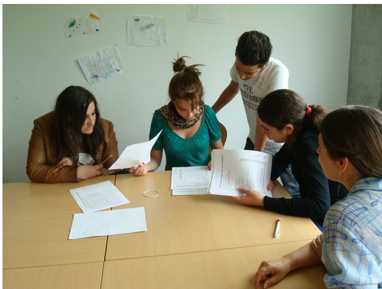
Schülergruppe bei der Auswertung der Interviews